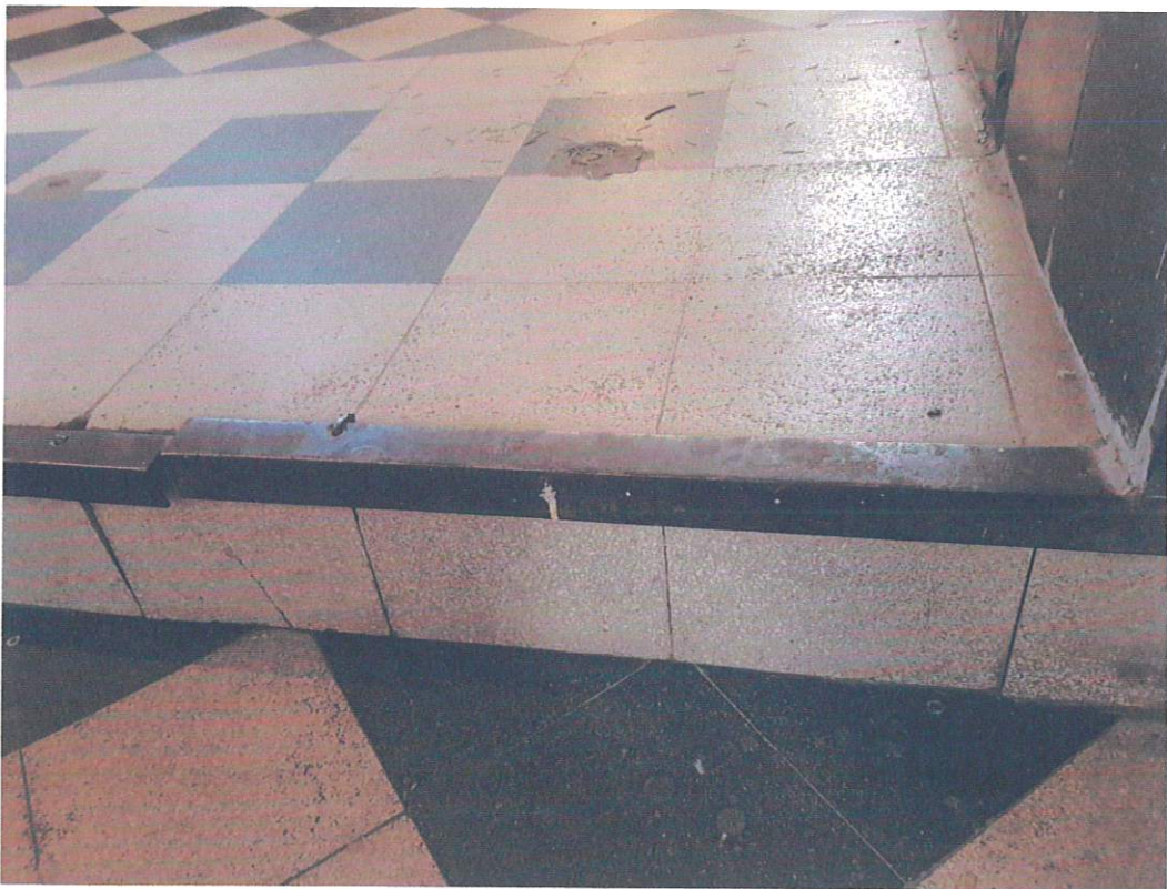
Fragment stopnia posadzki pomiędzy prezbiterium, a nawą, widoczne odspojenia i ubytki w płytkach z lastryko