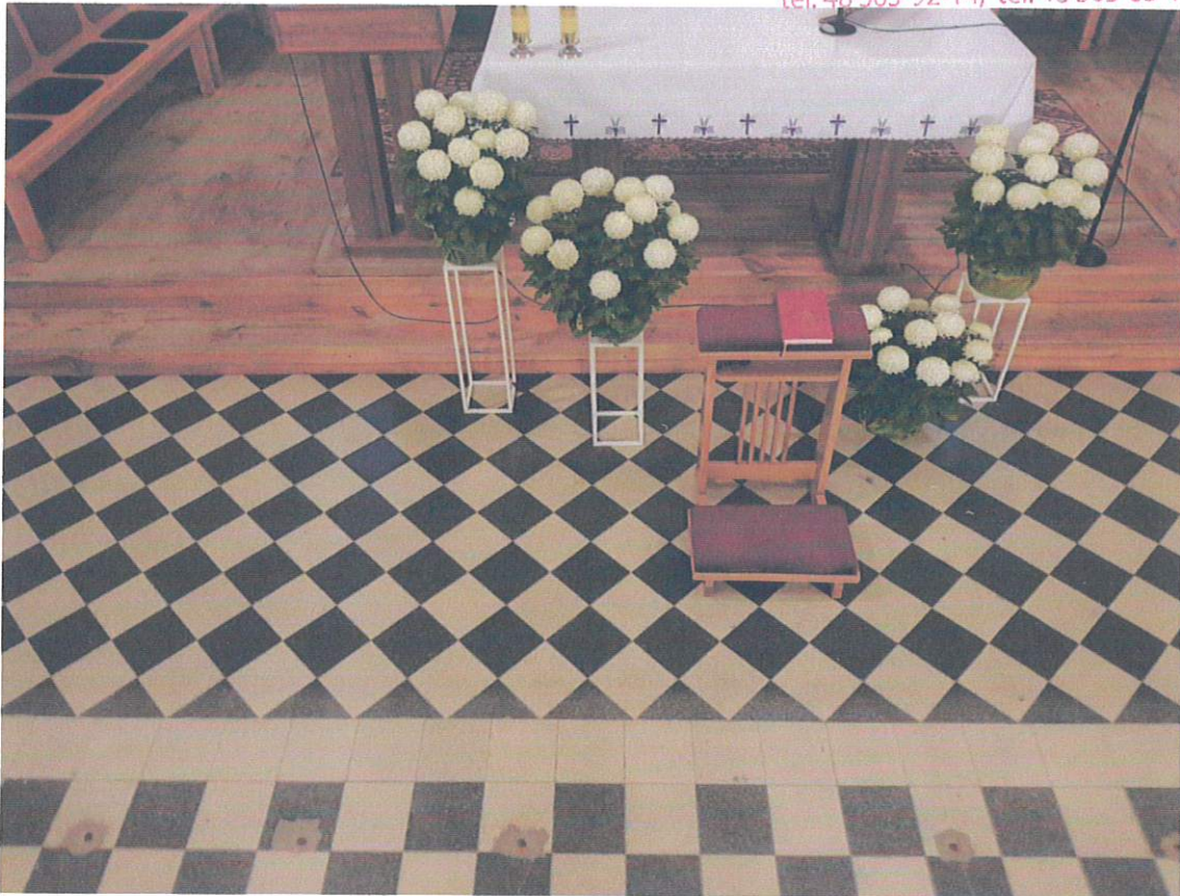
Fragment posadzki prezbiterium z drewnianym podestem. W dolnej partii fotografii widoczne ślady po kotwieniu niezachowanych tralek.